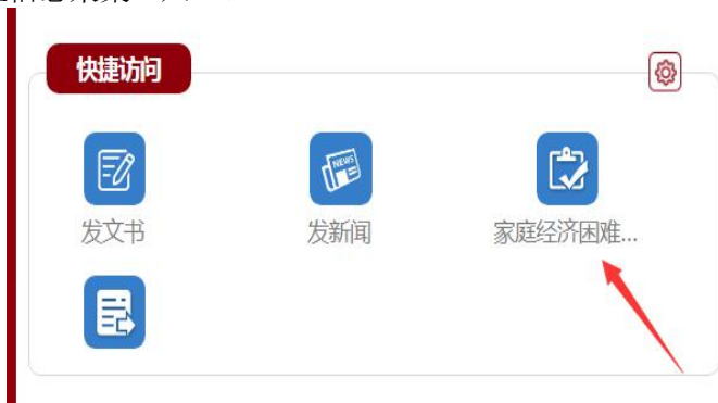
图 2 在快捷访问处找到家庭经济困难学生信息采集入口

第二步： 登陆账号后找到“快捷访问”，下方点击“家庭经济困难学生信息采集”入口。