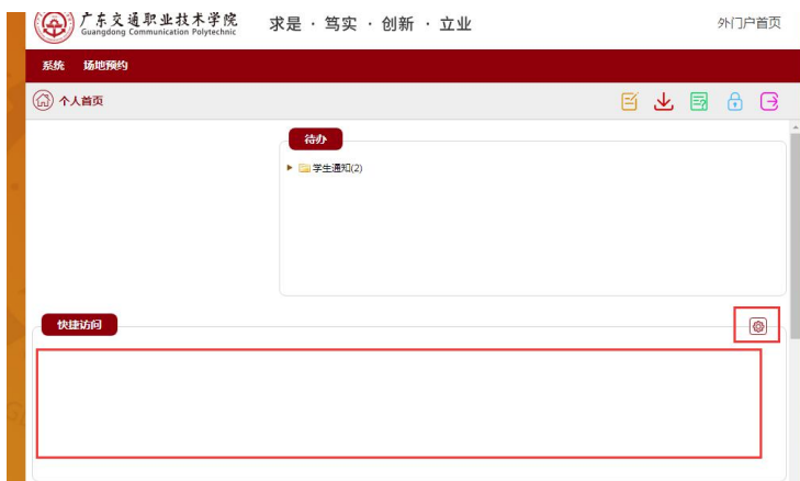
图 3 点击右上角齿轮

然后拖拽“家庭经济困难学生信息采集”的快捷方式，从右侧拖拽到左侧，然后点击保存。这样就可以在快捷方式中轻松找到家庭经济困难学生信息采集入口了。