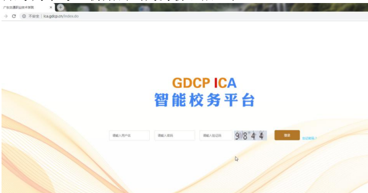
图 1 广东交通职业技术学院 ICA 登录界面

第二步： 登陆账号后找到“快捷访问”，下方点击“家庭经济困难学生信息采集”入口。