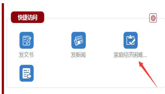
图 2 在快捷访问处找到家庭经济困难学生信息采集入口

第二步： 登陆账号后找到“快捷访问”，下方点击“家庭经济困难学生信息采集”入口。